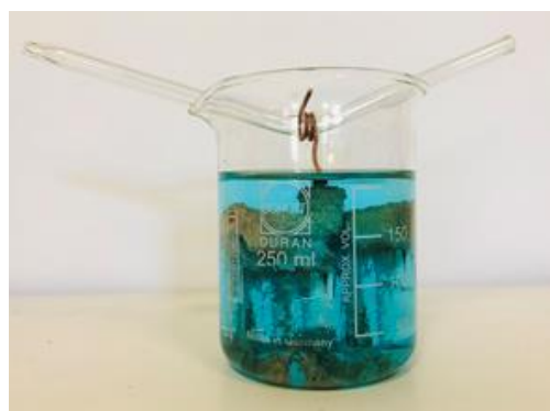
État final (après plusieurs heures)